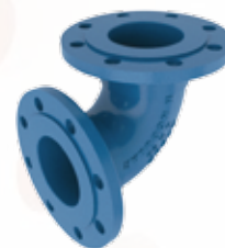
Extremo Bridado (ANSI/ISO)

Disponible también con otros extremos: Junta rápida para PVC. Liso para PVC. Garra de Tigre. Garra de Tigre para PE.