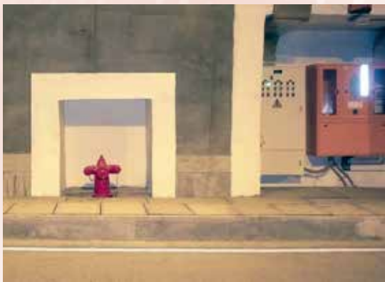
Instalación actual Túnel de Sumapaz en la vía Bogotá-Girardot